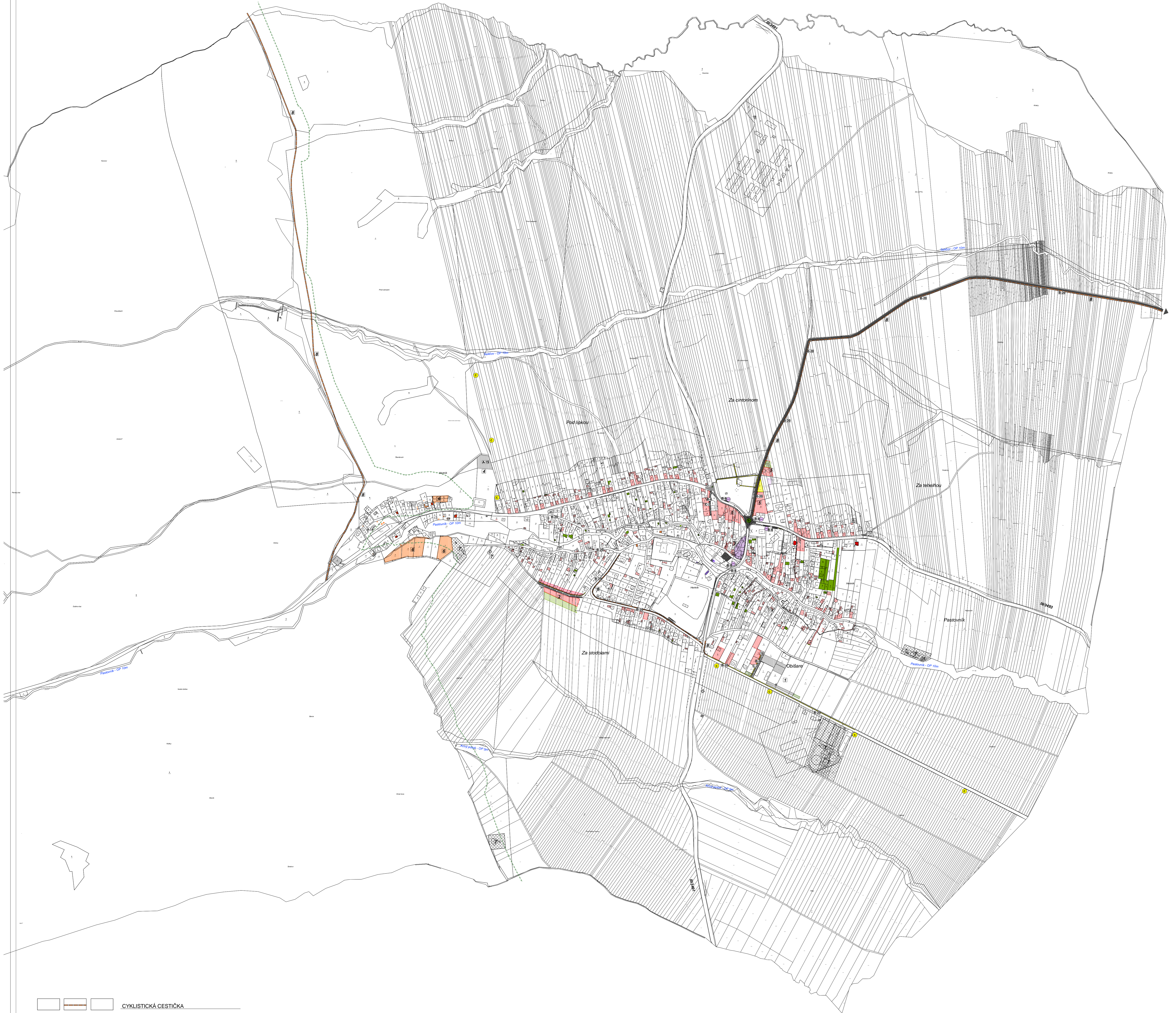
B-20 CYKLISTICKÉ CESTIČKY, ULICE A CYKLOTRASY