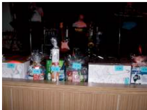
Posedenie s dôchodcami